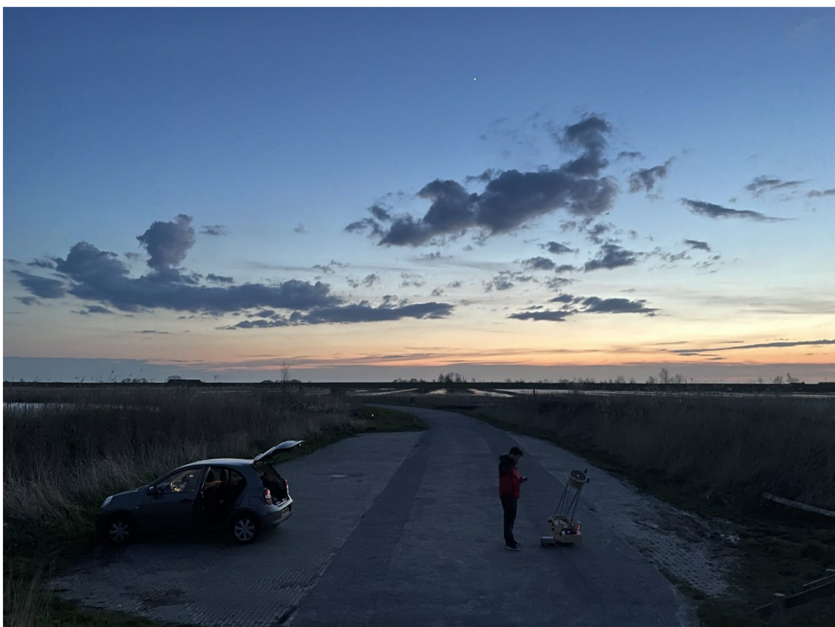
Sterrenkijken bij het Lauwersmeer.

Ik woon in Arnhem en volgens de Atlas Leefomgeving kan ik thuis 358 sterren zien. Best aardig toch? Nou, dat kan veel beter! Er zijn locaties in het land waar volgens diezelfde atlas meer dan 2000 sterren zichtbaar zijn. Ik pakte mijn telescoop en bezocht een van die plekken.